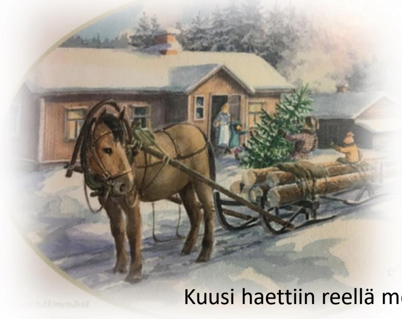
Kuusi haettiin reellä metsästä.

Tuomaan risti on perinteinen joulukoriste, joka veistettiin puusta.