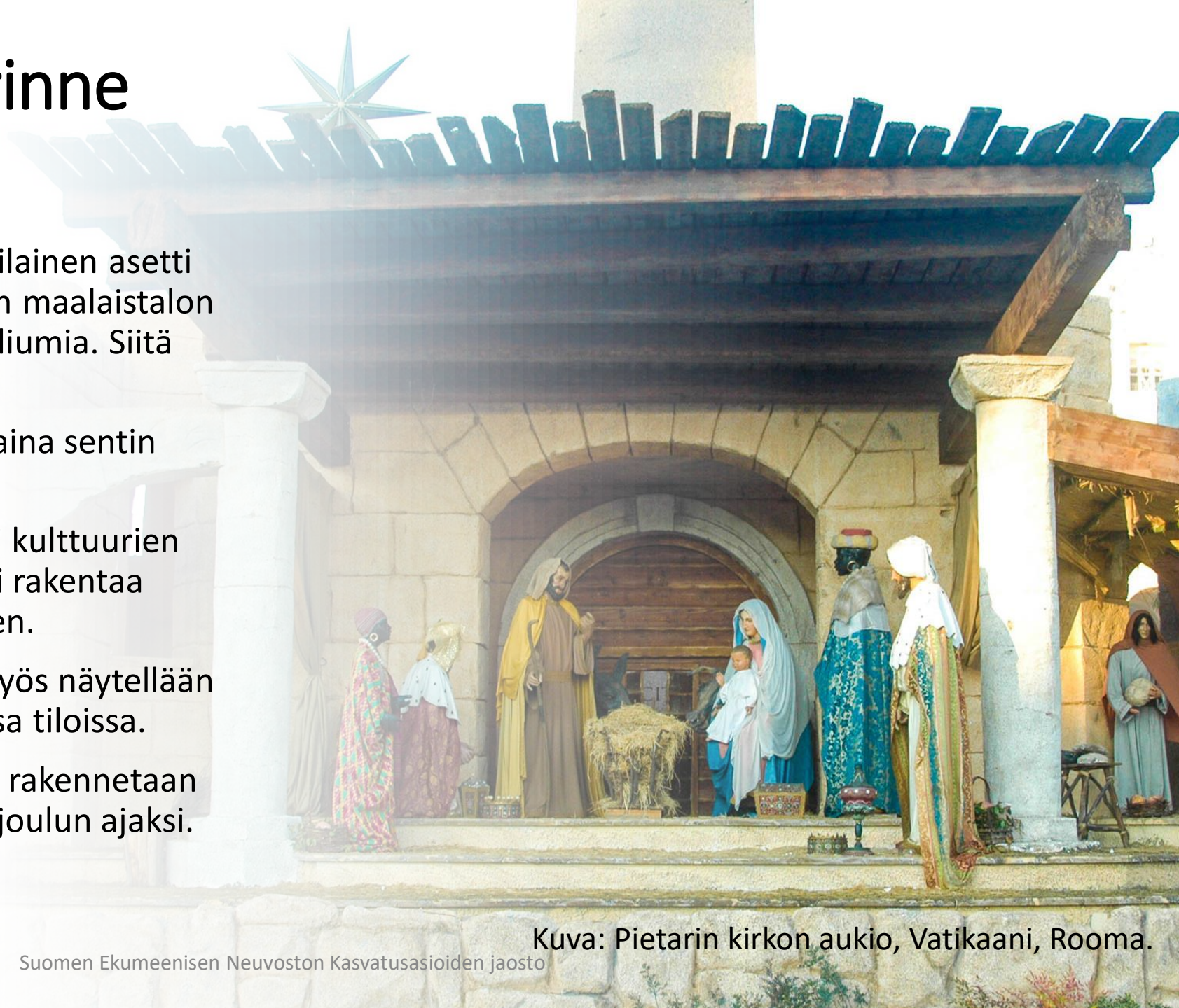
Kuva: Pietarin kirkon aukio, Vatikaani, Rooma.